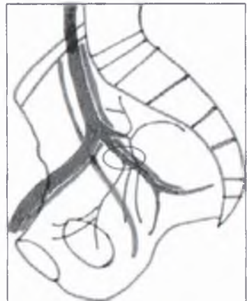
Рис. 4. Лигирование внутренних подвздошных артерий