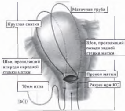
Рис. 1. Техника наложение компрессионного шва по В-Лynch