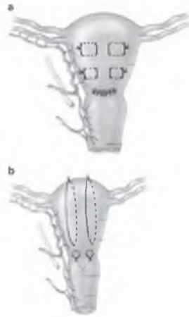
Рис. 2. Техника наложение компрессионных швов.